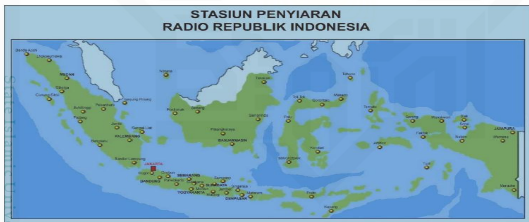
Gambar 4.1 Penyebaran Stasiun RRI di Indonesia