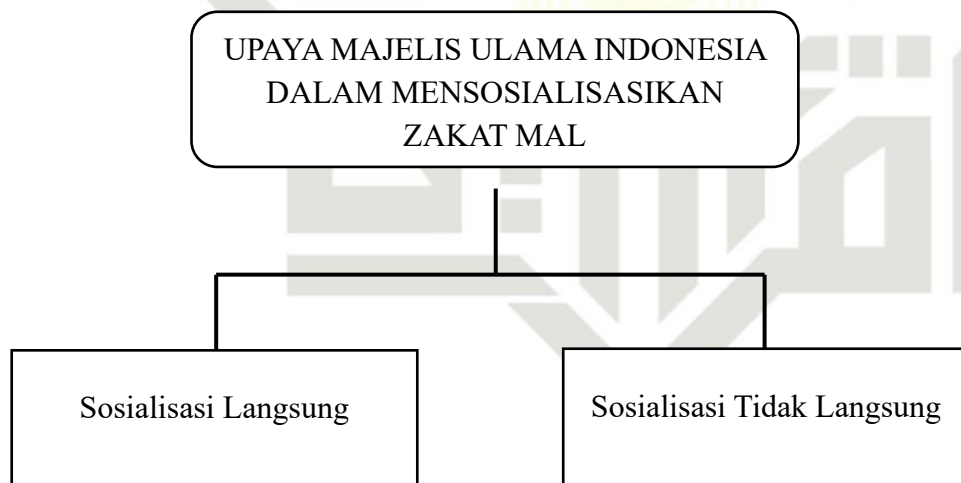
Gambar 2.1 Kerangka Pikir

Kerangka pemikiran adalah penjelasan sementara mengenai gejala yang menjadi fokus permasalahan. Penyusunannya didasarkan pada tinjauan pustaka serta hasil penelitian yang relevan dan terkait. Melalui kerangka pemikiran, hubungan antar variabel yang akan diteliti dapat digambarkan, sehingga memungkinkan penyusunan hipotesis penelitian yang berfungsi sebagai jawaban sementara terhadap isu yang dihadapi. Selain itu, kerangka pemikiran juga berperan dalam mencari cara untuk memetakan solusi bagi permasalahan yang ada. (Andriani, Hasniwati, 2022)