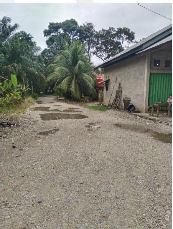
if Kasim Riau