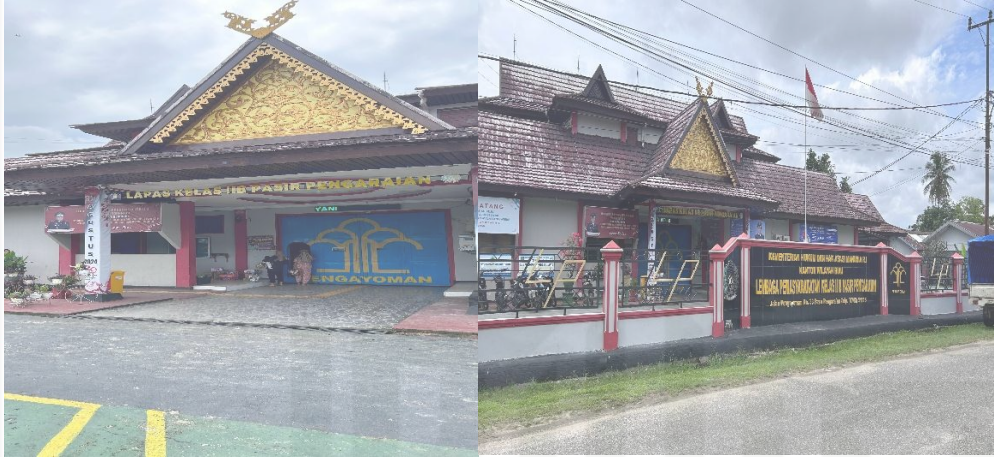
Lapas kelas IIB Pasir Pengaraian Kabupaten Rokan Hulu