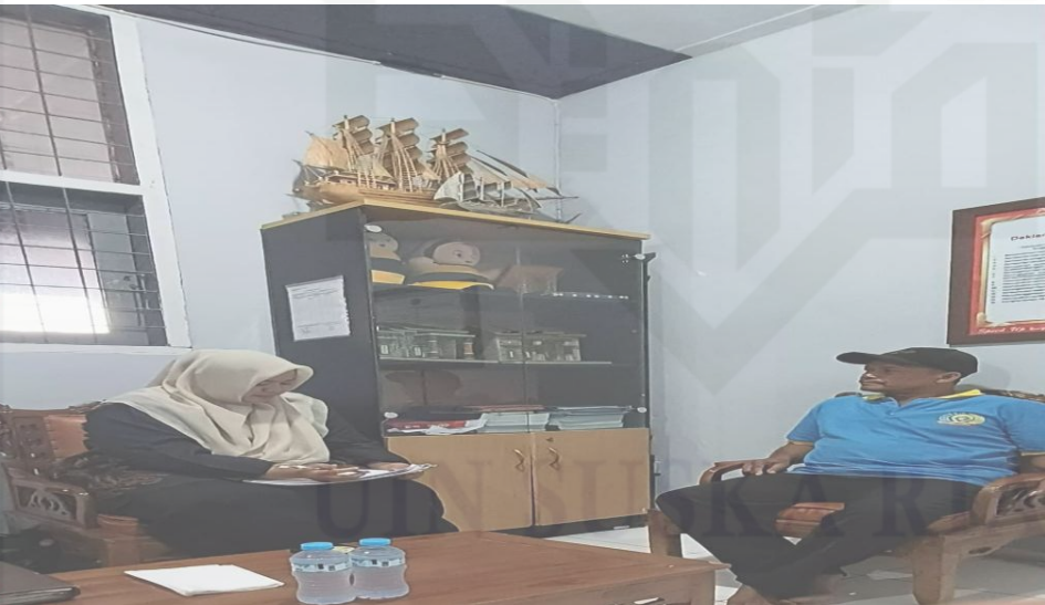
Wawancara dengan 5 Narapidana dilapas Kelas IIB Pasir Pengaraian Kabupaten Rokan Hulu