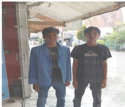
Wawancara Dengan Para Pembeli Voucher Internet Di Konter Zhofron Data Celluler