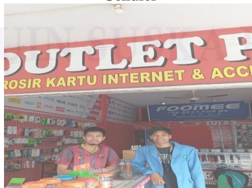
Wawancara Bersama Pihak Distributor Voucher Internet