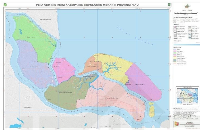
Gambar 4.1 peta wilayah Kabupaten Kepulauan Meranti