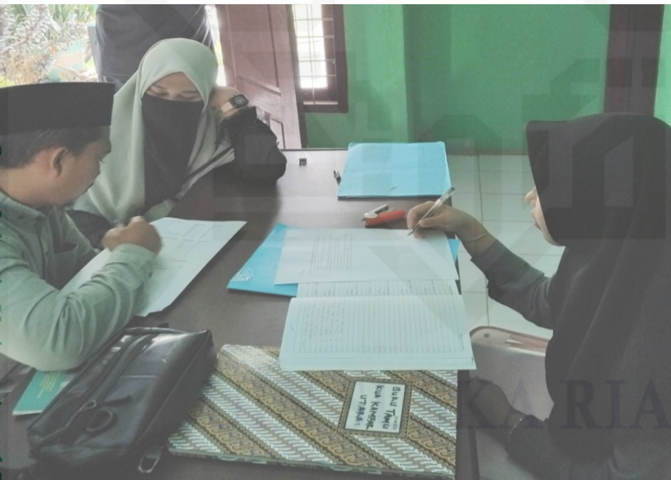
Keterangan : Gambar ketika melakukan wawancara dengan Calon Pengantin di KUA Kec. Kampar Utara