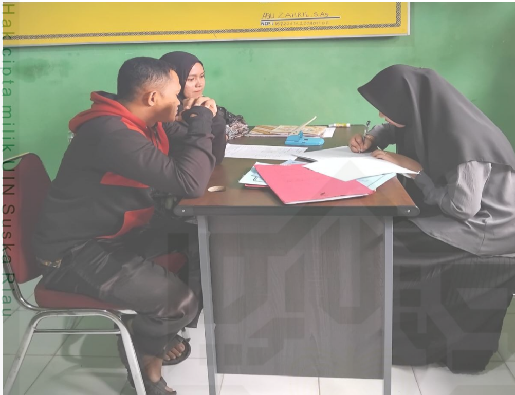
Keterangan : Gambar ketika melakukan wawancara dengan Calon Pengantin di KUA Kec. Kampar Utara

State Islamic University of Sultan Syarif Kasim Riau