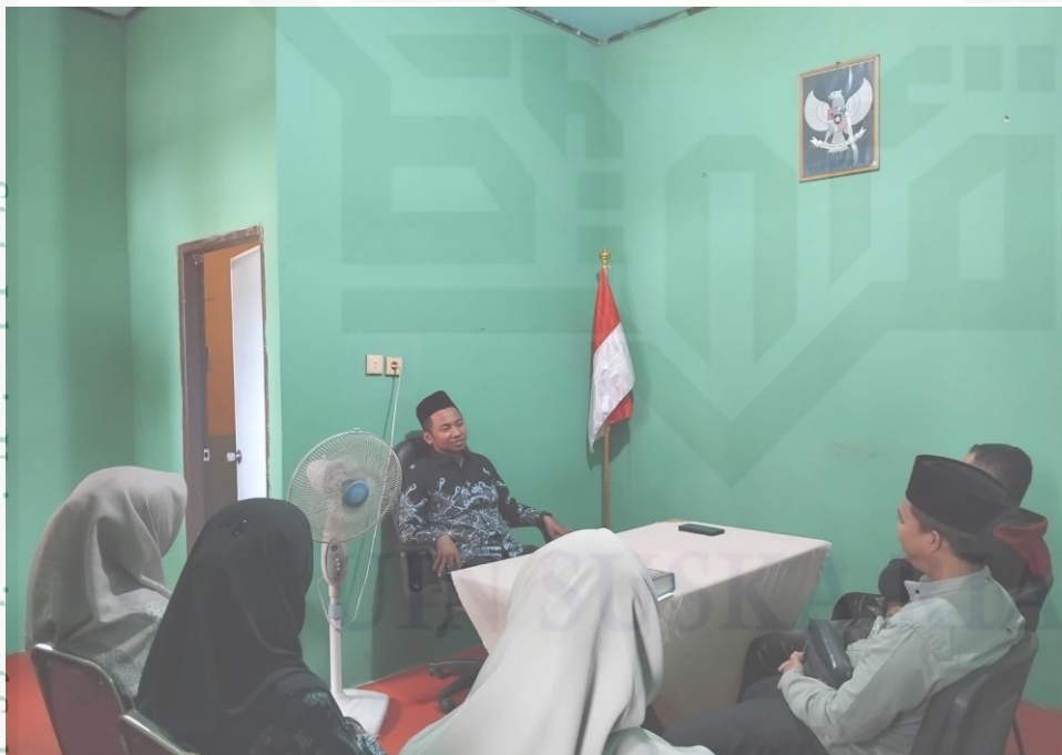
Keterangan: Gambar Ketika Penyuluh sedang memberikan layanan Bimbingan Pra Nikah Kepada Calon Pengantin di Ruang Kepala Kantor KUA Kec. Kampar Utara