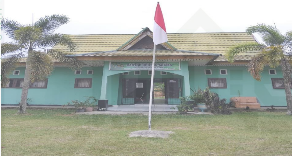
Keterangan : Gambar Kantor Urusan Agama (KUA) Kec. Kampar Utara