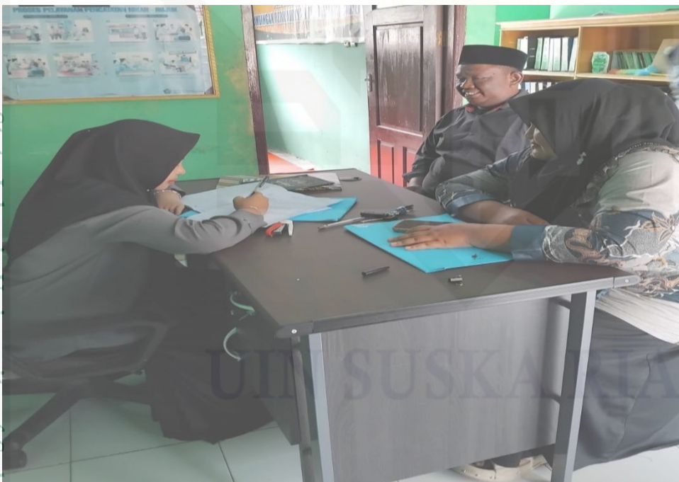
Keterangan : Gambar ketika melakukan wawancara dengan Calon Pengantin di KUA Kec. Kampar Utara

State Islamic University of Sultan Syarif Kasim Riau