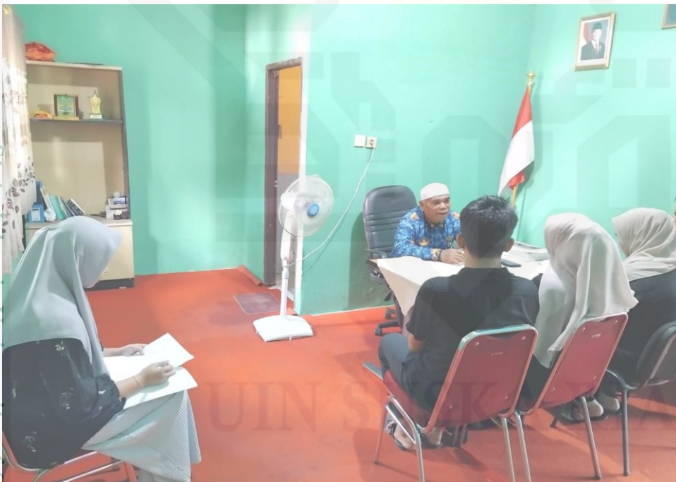
Keterangan : Gambar ketika Kepala KUA Kec. Kampar Utara melakukan layanan bimbingan pra nikah dengan Calon Pengantin di Ruang Kepala KUA Kec. Kampar Utara