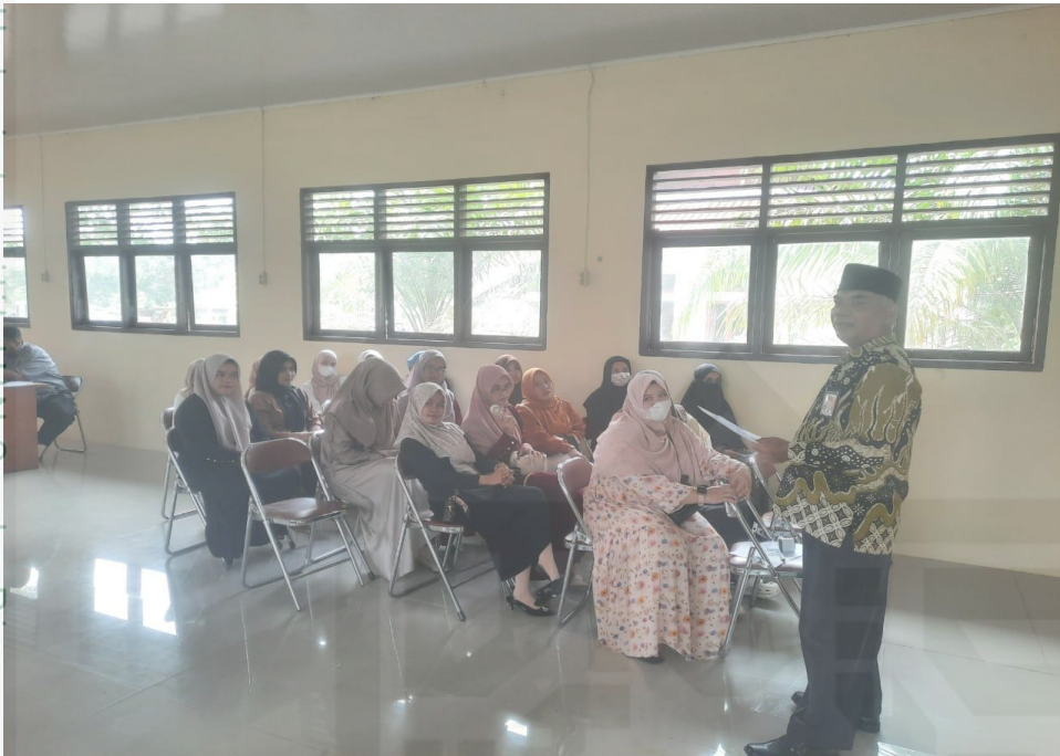
Keterangan : Gambar ketika Kepala KUA Kec. Kampar Utara melakukan layanan bimbingan pra nikah dengan Calon Pengantin di Aula Kantor Camat Kampar Utara