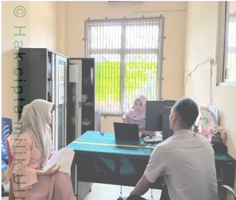
dokumentasi 5 Wawancara Informan Pendukung 3