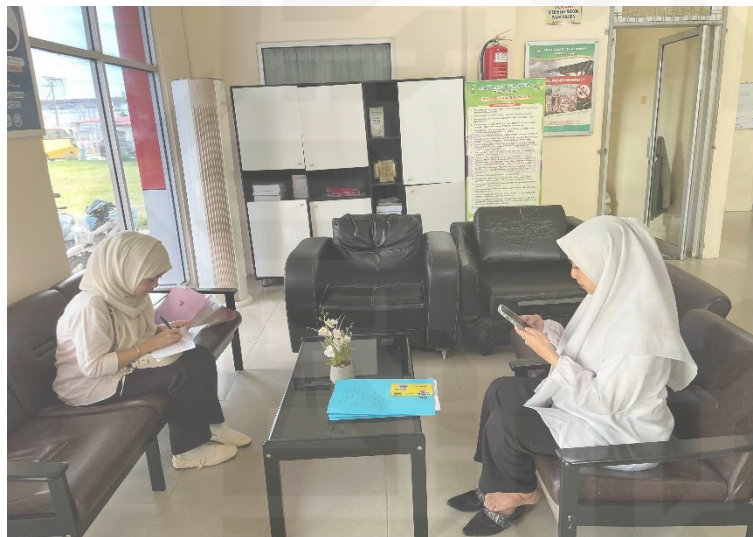
dokumentasi 2 Wawancara bersama Konselor