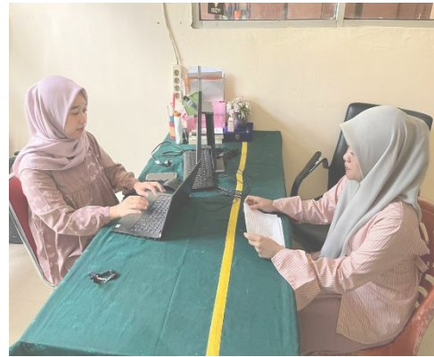
dokumentasi 6 Wawancara Konselor