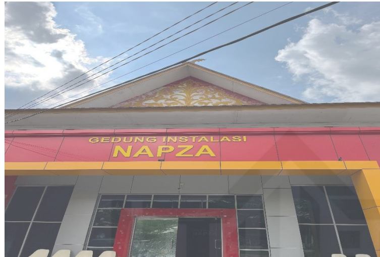
dokumentasi 1 Gedung Napza