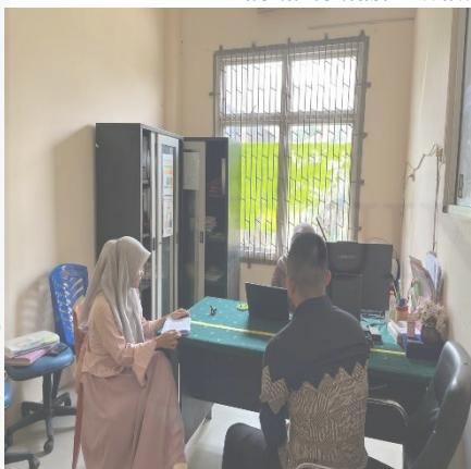
dokumentasi 3 Wawancara Informan Pendukung 1