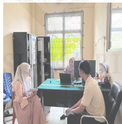
dokumentasi 4 Wawancara Informan Pendukung 2