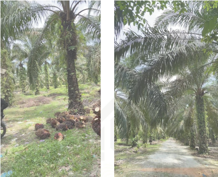
Dokumentasi pohon kelapa sawit