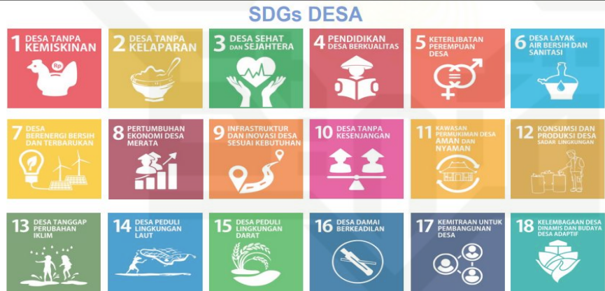
Tabel 2.1 Sustainable Development Goals (SDGs) Desa

SDGs Desa adalah implementasi konkret pembangunan nasional berkelanjutan di tingkat desa, Menurut Peraturan Presiden Nomor 59 Tahun 2017, tujuannya adalah untuk mencapai SDGs nasional melalui upaya terkoordinasi di tingkat desa, sejalan dengan RPJMN dan SDGs global menunjukkan komitmen Indonesia pada tujuan pembangunan berkelanjutan dunia (Pangestu et al., 2024).