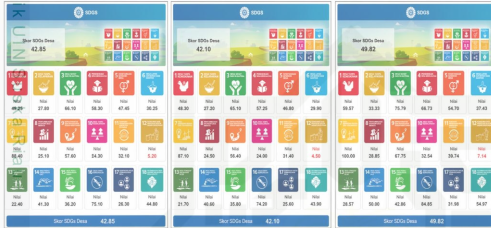
Tabel 1.2 Data Jumlah Perolehan Skor Tujuan SDGs Pada Desa Padang Luas Tahun 2023-2024 dan 2025

Keterangan: Nilai dalam satuan skor (0-100) Catatan: • Skor SDGs Desa merupakan rata-rata dari 18 tujuan SDGs Desa dengan skala 0-100. • Tahun 2023 mengalami penurunan pada poin 12 (Komunitas dan Produksi Desa Sadar Lingkungan). • Tahun 2024 mengalami penurunan sedikit pada poin 12 dibandingkan tahun 2023. • Tahun 2025 menunjukkan peningkatan lajuatan dibandingkan tahun 2024.