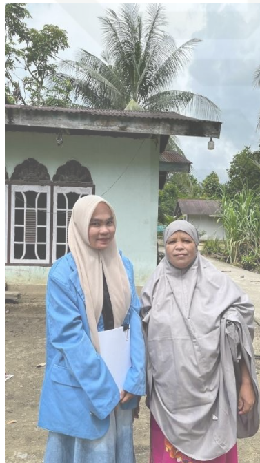
Wawancara dengan warga penerima PKH