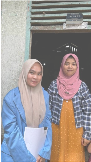
Wawancara dengan warga bukan penerima PKH