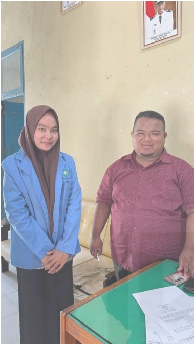
Wawancara dengan Sekretaris Desa Aursati