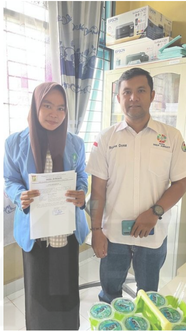
Wawancara dengan Perangkat Desa Aursati