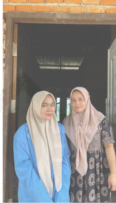
Wawancara dengan warga penerima PKH