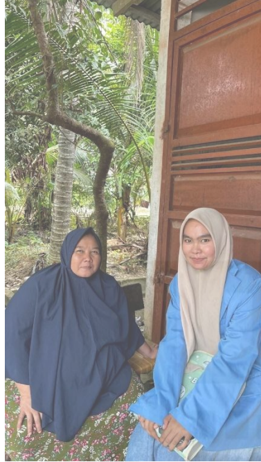
Wawancara dengan warga penerima PKH