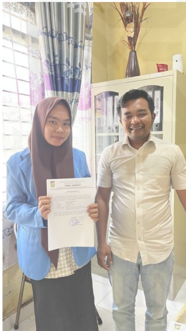
Wawancara dengan Perangkat Desa Aursati