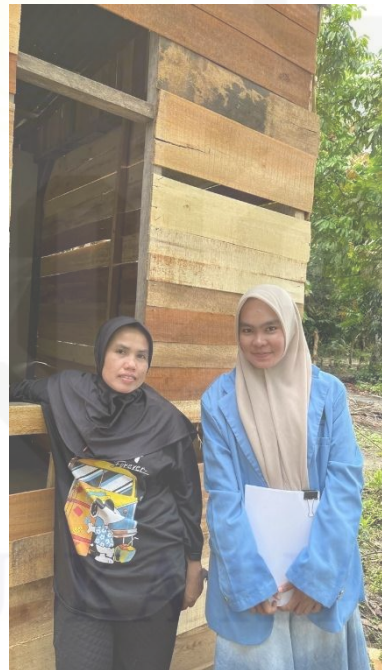
Wawancara dengan warga bukan penerima PKH