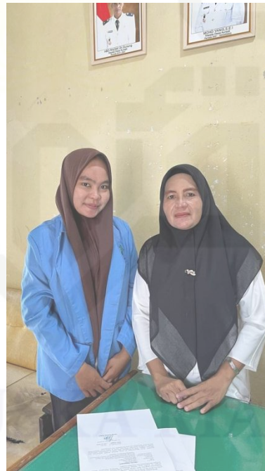
Wawancara dengan Perangkat Desa Aursati