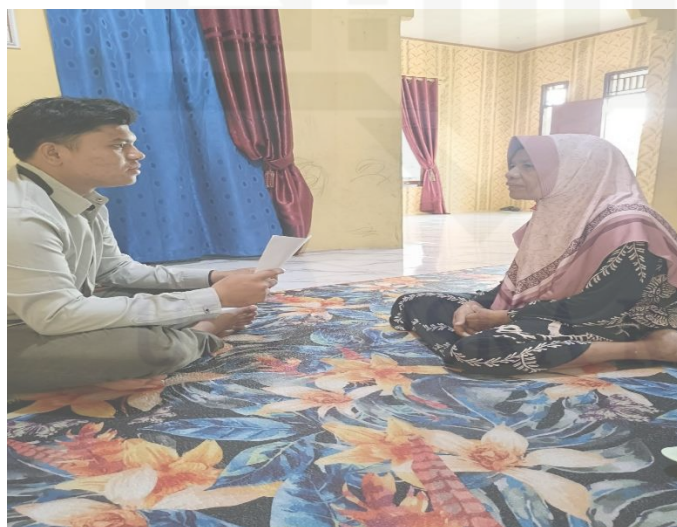
Wawancara dengan Ibu Siah Saudari kandung Perempuan almarhum Is