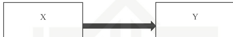
Diagram pemikiran Variabel Bebas Metode Preview, Question, Read, Reflect, Recite, Review (X) terhadap Variabel Terikat kemampuan membaca pemahaman (Y).

Untuk mendapatkan gambaran yang jelas tentang pengaruh variabel bebas (X) dan variabel terikat (Y) makna dapat di gambarkan sebagai berikut: