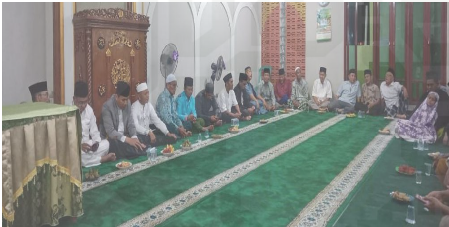
Gambar 8 Kajian Rutin Jum'at malam & Ahad Subuh