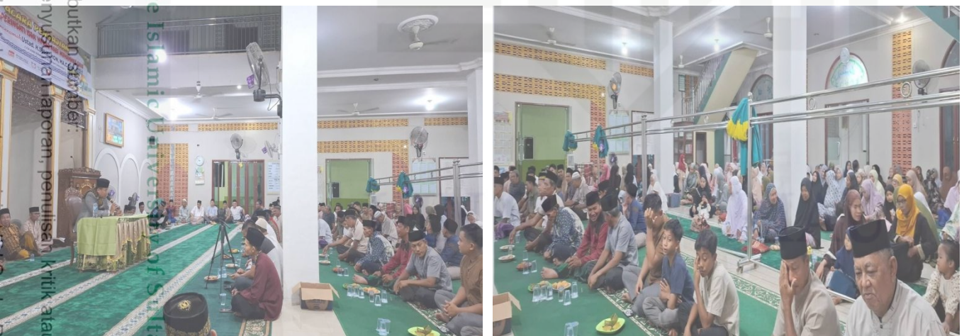
Gambar 9 Peringatan Hari Besar Islam