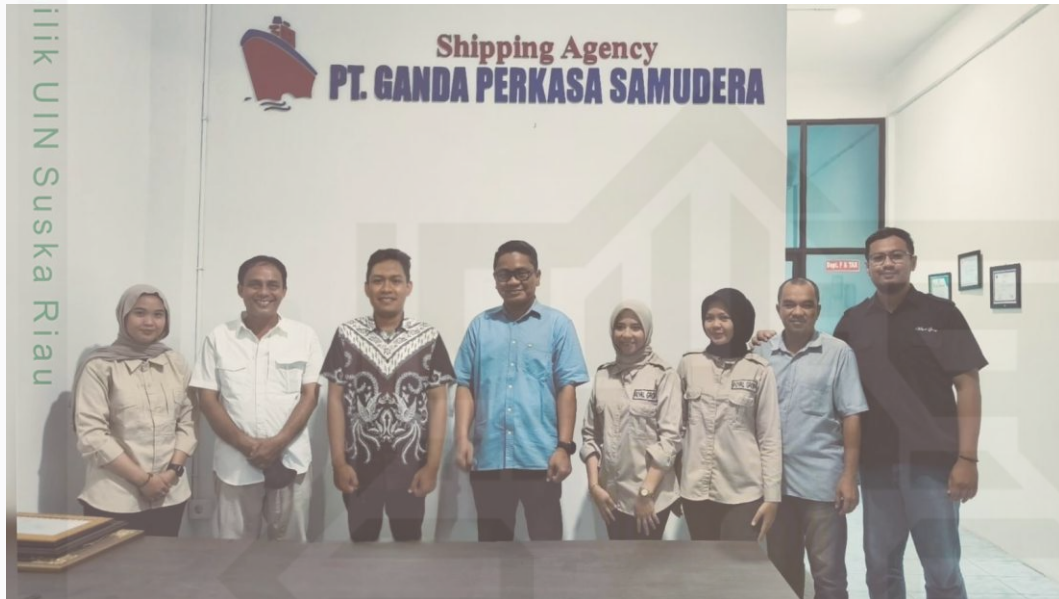
Foto bersama dengan staff PT. Ganda Perkasa Samudra