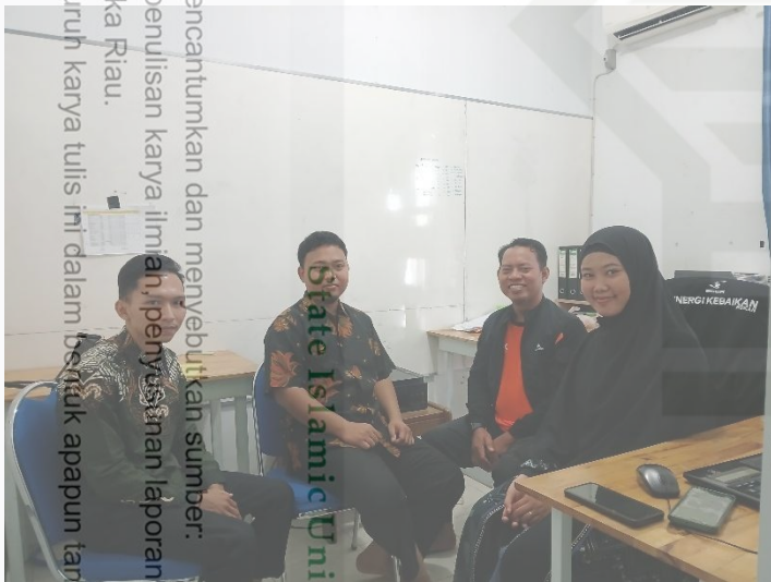
Gambar 3: Wawancara dengan staf LAZ Energi Kebaikan Rokan