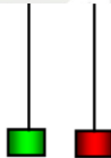
Gambar 2. 1 : Grafik Candlestick Shooting Star

bawah, sedangkan resistance merupakan batas atas. Bisa disimpulkan Support dan Resistance merupakan garis pembatas tingkat kekuatan suatu penawaran dan permintaan, jika harga menyentuh garis resistance maka mengakibatkan jenuh beli ( overbought ) yang disebut bullish trend dan jika harga menyentuh garis support maka mengakibatkan jenuh jual ( oversold ) yang disebut bearish trend . Berikut contoh penggunaan grafik Candlestick :