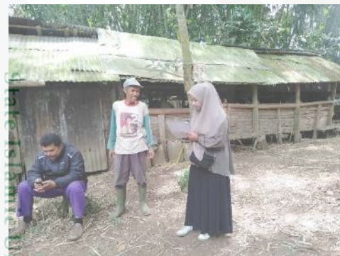
Proses wawancara bersama peternak