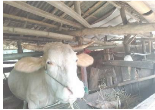
Salah satu Sapi potong milik peternak