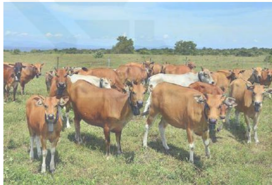
Gambar 2.5. Sapi pesisir

berperan penting dalam sistem usaha tani dan telah dipelihara peternak secara turun-temurun. Sifat-sifat unggul sapi lokal antara lain mampu beradaptasi dengan baik terhadap pakan berkualitas rendah dan sistem pemeliharaan ekstensif tradisional, serta tahan terhadap penyakit dan parasit. Sapi pesisir merupakan sapi lokal yang memiliki tubuh berukuran kecil dan banyak dipelihara oleh petanipeternak di Sumatera Barat (Hendri, 2013). Sapi pesisir merupakan salah satu rumpun sapi lokal dan telah beradaptasi dengan baik di daerah pesisir pantai, Kabupaten Pesisir Selatan, Provinsi Sumatera Barat. Masyarakat Sumatera Barat menyebut sapi lokal pesisir dengan nama lokal, misalnya jawi ratuih atau bantiang ratuih, yang artinya sapi yang melahirkan banyak anak. Sapi Pesisir merupakan plasma nutfah asli Indonesia yang hidup dikawasan pesisir Sumatera Barat, telah ditetapkan sebagai rumpun melalui SK Menteri Pertanian No. 2908/Kpts/OT.140/6/2011. Populasi sapi pesisir ditemukan di Kabupaten Pasaman Barat, Kabupaten Padang Pariaman, kabupaten Agam, Kota Padang dan Kabupaten Pesisir Selatan (Erlita, 2016). Gambar Sapi pesisir dapat dilihat pada Gambar 2.5. dibawah ini :