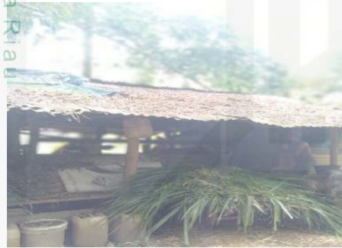
Pakan sapi peternak