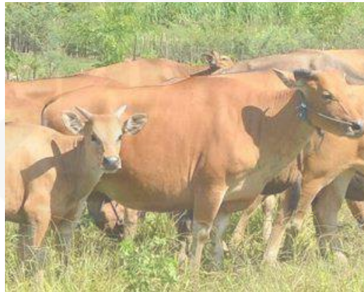
Gambar. 2.3. Sapi Bali

tropis, khususnya di Asia, jauh lebih banyak apabila dibandingkan dengan sapi-sapi yang berasal dari Eropa meskipun secara umum sumbangan Zebu sebagai ternak potong atau konsumsi dirasakan masih rendah. Hal ini dikarenakan secara genetis produksi dagingnya rendah bila dibandingkan dengan bangsa sapi Eropa. Beberapa bangsa sapi tropis sudah cukup terkenal, berkembang dengan baik dan banyak ditemukan di Indonesia (Susilorini dan Sawit 2008; Sugeng, 1998; Hosen dkk., 2010). Utomo (2016) Bangsa sapi tropis ini selanjutnya lebih dikenal sebagai sapi-sapi Indonesia (sapi lokal Indonesia). Beberapa bangsa sapi lokal Indonesia diantaranya adalah sapi Bali, sapi Madura, sapi Ongole, sapi Pesisir, dan sapi Jawa Brebes (sapi Jabres). Sapi Bali dapat pada Gambar 2.3. dan Sapi Jabres dapat dilihat pada Gambar 2.4. berikut ini :