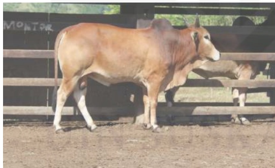
Gamabar 2.4. Sapi Jabres (Jawa Brebes)

Sapi lokal memiliki peran strategis dalam memajukan prekonomian, membuka lapang kerja, dan memenuhi kebutuhan protein-hewani. Sapi lokal juga