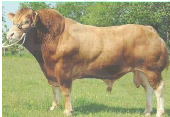
Gambar 2.2. Sapi limosine

Bangsa-bangsa sapi tropis di Asia yang dikenal adalah Zebu ( Bos indicus ), dan banteng ( Bos sondaicus atau Bos bibos ) atau hasil persilangan kedua golongan tersebut. Bangsa sapi tropis saat ini telah menyebar hampir keseluruhan daerah tropis di seluruh dunia terutama di benua Asia dan Afrika. Penyebaran Zebu didaerah