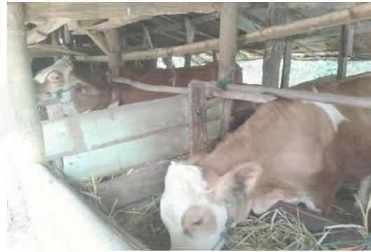
Sapi Potong Peternak