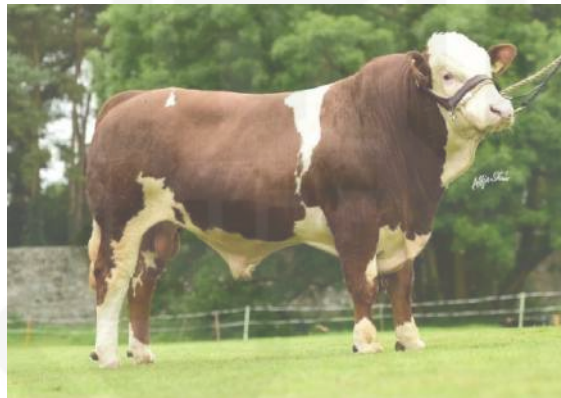
Gambar 2.1. Sapi Simental

Berdasarkan asal-usulnya, bangsa sapi yang sudah berkembang di Indonesia secara umum dapat dibedakan menjadi dua, yaitu bangsa sapi sub tropis dan bangsa sapi tropis Utomo (2016). Bangsa sapi yang sub tropis yang sudah berkembang di Indonesia adalah Simental, Limousine, Angus, Brahman, Hereford, Shorthorn, Santa Getrudis, Beefmaster (Susilorini dan Sawit 2008). Dari semua jenis sapi tersebut yang sudah banyak diternakkan dan dipelihara oleh peternak dan berkembang di tingkat pedesaan adalah sapi Peranakan Simental, Limousine, Angus dan sapi Brahman Utomo (2016). Sapi Simental dapat dilihat pada Gambar 2.1. dan Sapi Limosine dapat dilihat pada Gambar 2.2. berikut ini :