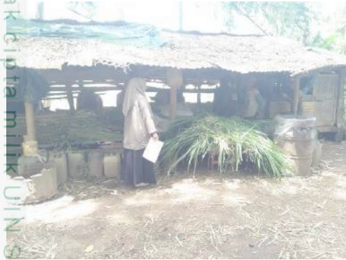
Kandang ternak sapi