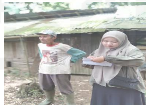
Proses wawancara bersama peternak