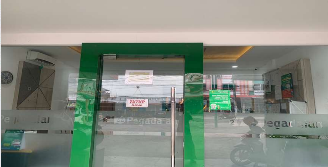
Gambar 2.1 Kantor Pegadaian Delima

Pegadaian merupakan lembaga perkreditan rakyat dengan system gadai, lembaga semacam ini pada awalnya berkembang di Italia yang kemudian di praktekkan di wilayah-wilayah Eropa lainnya misalnya Inggris dan Belanda. Sistem gadai tersebut masuk ke Indonesia di bawa dan berkembang oleh Belanda (VOC) yaitu sekitar abad ke 19. Dalam rangka memperlancar kegiatan perekonomian VOC mendirikan Bank Van Leening yaitu lembaga kredit dengan system gadai. Bank Van Leening di dirikan pertama di Batavia pada tanggal 20 Agustus 1764 berdasarkan keputusan Gubernur Jendral Van Imhoff. Tetapi setelah inggris mengambil alih kekuasaan Indonesia dari Belanda (1811-1816) Bank Van Leening milik Belanda tersebut di bubarkan dan Gubernur Jendral