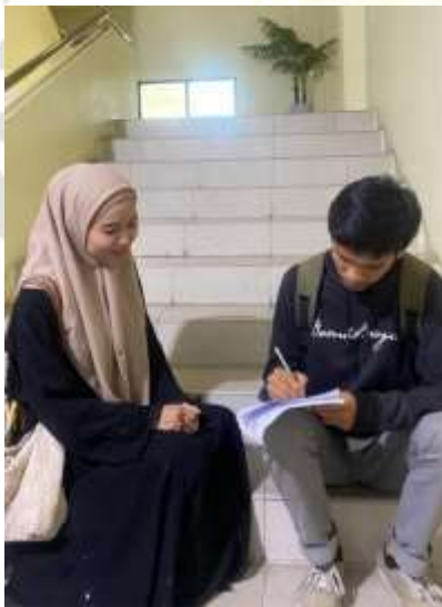
Pengisian kusioner dengan santri putra Dar El Hikmah