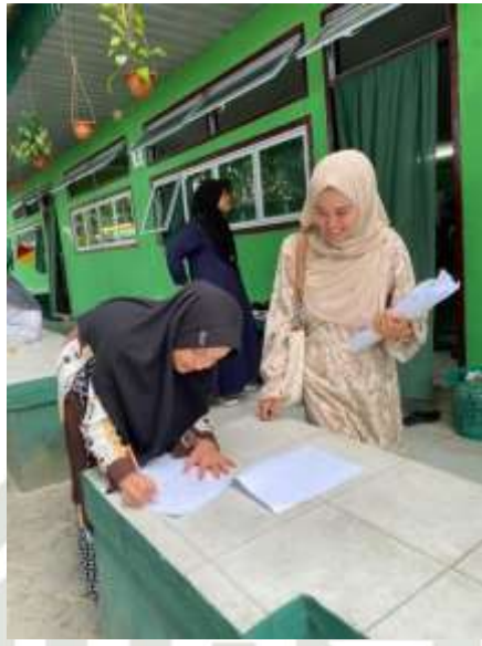
Pengisian kusioner dengan santri putri Dar El Hikmah