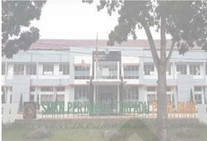
Lampiran 1.5 SMKN Pertanian Terpadu Provinsi Riau