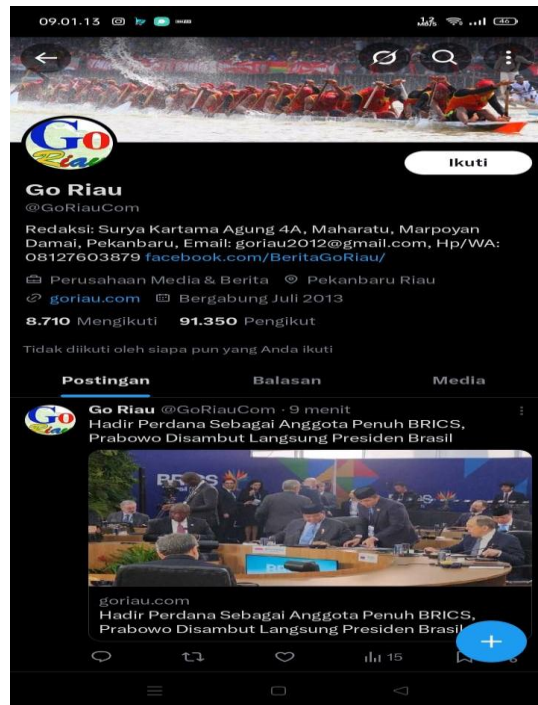
Profil X GoRiau