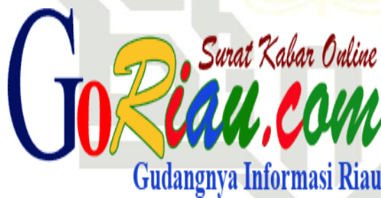
Gambar 4.1 Logo GoRiau

Pada awalnya, GoRiau.com mungkin memulai operasinya dengan fokus pada berita-berita umum seputar pemerintahan, politik, ekonomi, dan sosial budaya di wilayah Riau. Seiring berjalannya waktu, portal ini terus mengembangkan cakupan beritanya, tidak hanya terbatas pada Pekanbaru sebagai ibu kota provinsi, tetapi juga menjangkau kabupaten/kota lainnya di Riau.