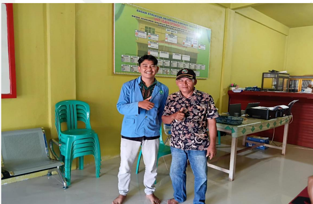
Dokumentasi bersama Sekretaris KPPA desa Gunung Malelo