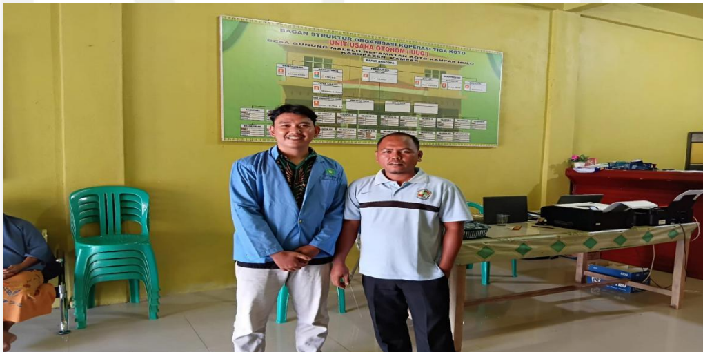
Dokumentasi bersama Tata Usaha KPPA desa Gunung Malelo