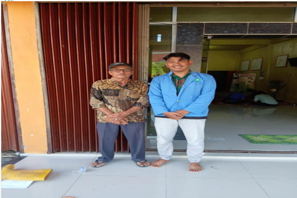
Dokumentasi bersama anggota kelompok KPPA desa Gunung Malelo