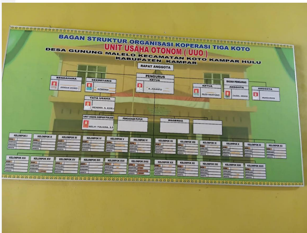
Bagan Stuktur Orgaisai Koperasi KPPA desa Gunung Malelo