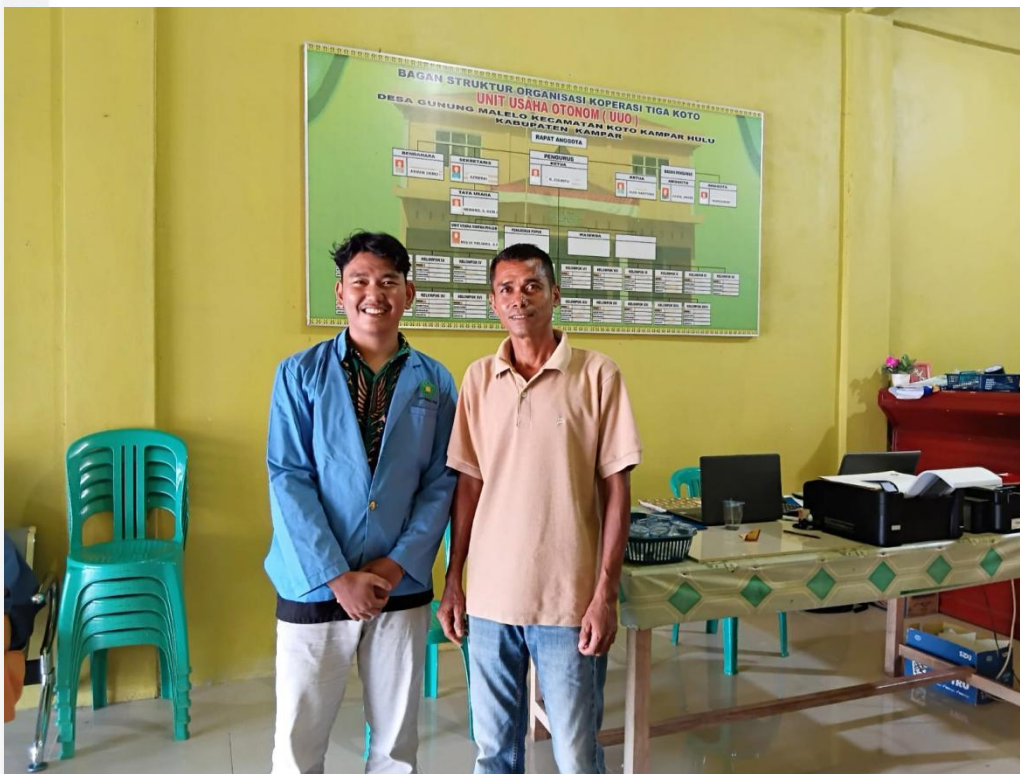
Dokumentasi bersama Bendahara KPPA desa Gunung Malelo