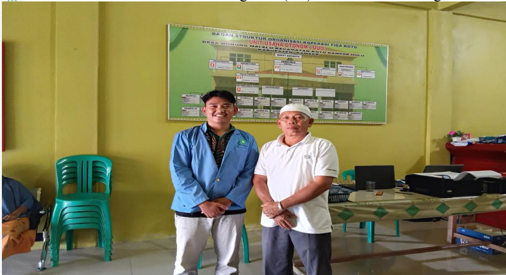
Dokumentasi bersama Pengurus Koperasi KPPA desa Gunung Malelo