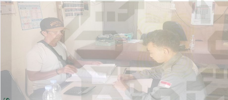
Dokumentasi wawancara bersama Krani PT. TIS