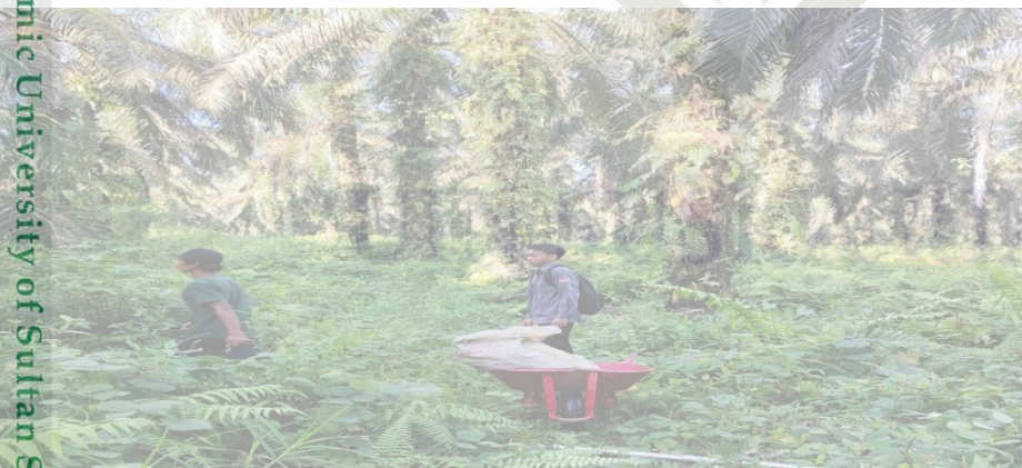
Kegiatan Observasi Lapangan