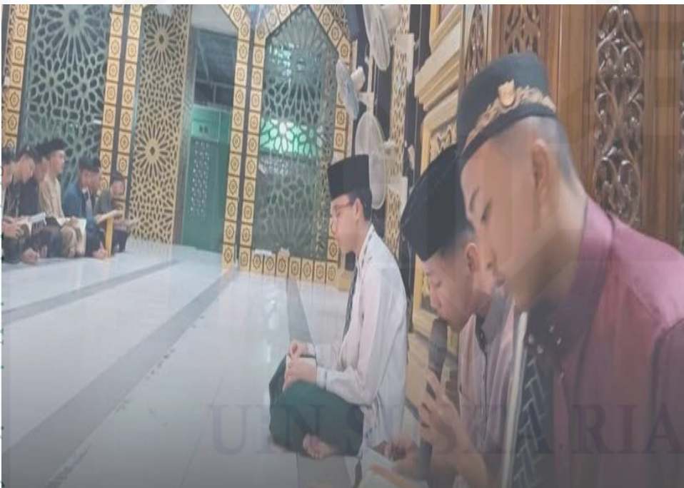
Dokumentasi musyrif sebagai pembimbing kegiatan ibadah di masjid

State Islamic University of Sultan Syarif Kasim Riau