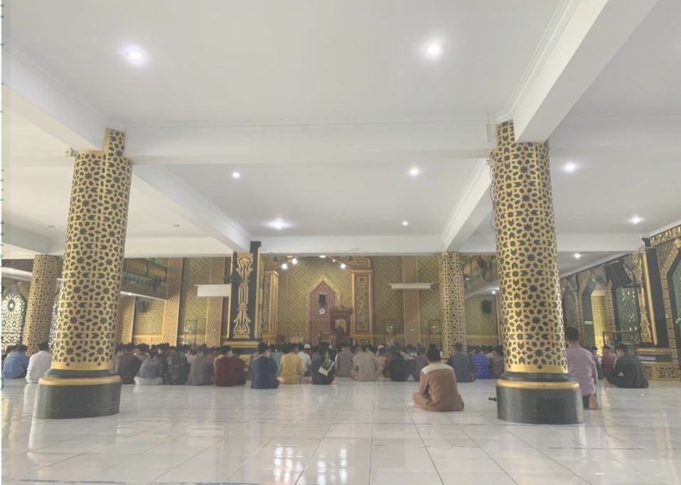
Suasana santri mengaji di masjid