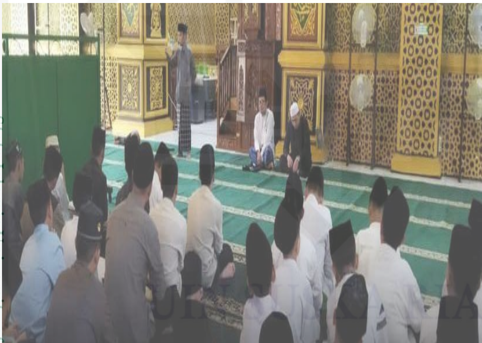
Dokumentasi musyrif memberikan evaluasi kepada santrinya