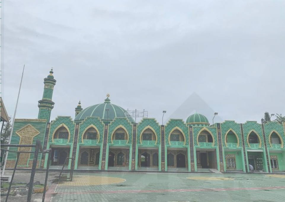
Masjid Pondok Pesantren Dar El Hikmah Pekanbaru