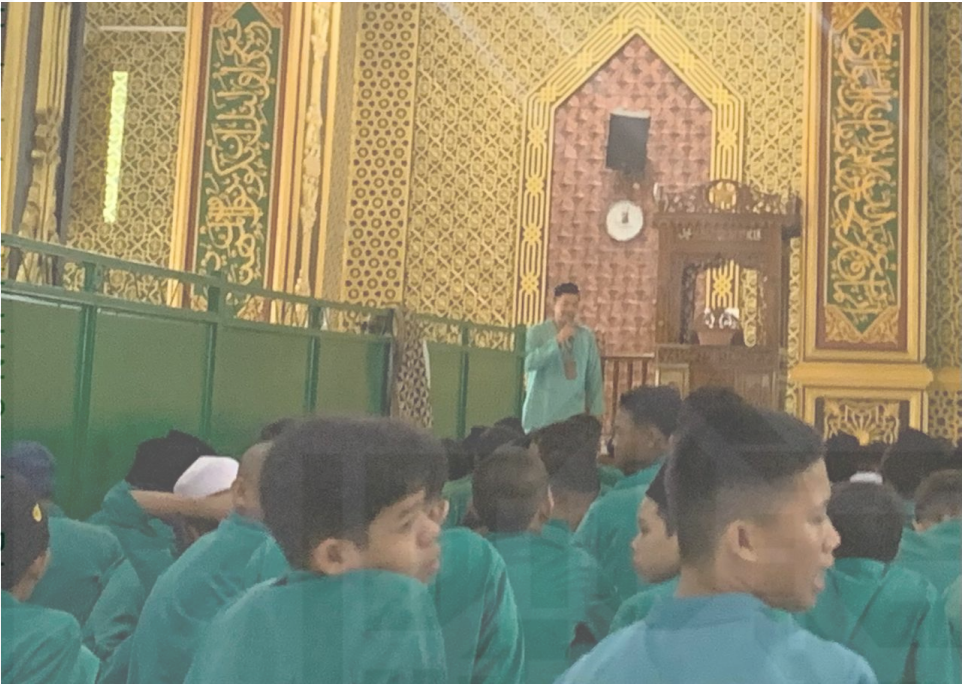
Dokumentasi musyrif sebagai pengingat dan pengawas bagi para santrinya