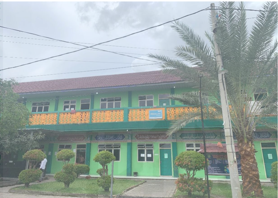
Asrama santri Pondok Pesantren Dar El Hikmah