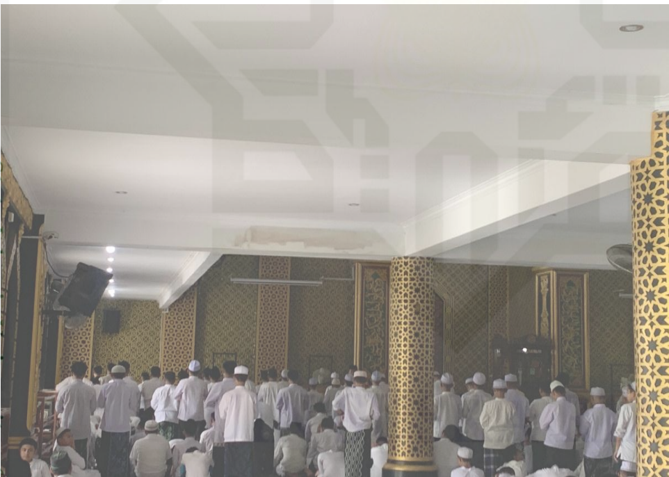
Suasana ketika santri beribadah shalat di masjid