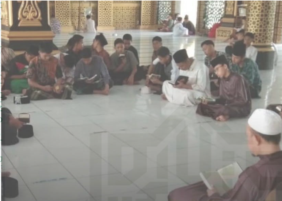
Dokumentasi musyrif sebagai suri tauladan bagi para santrinya