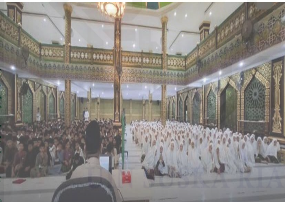
Dokumentasi musyrif memberikan motivasi kepada santri