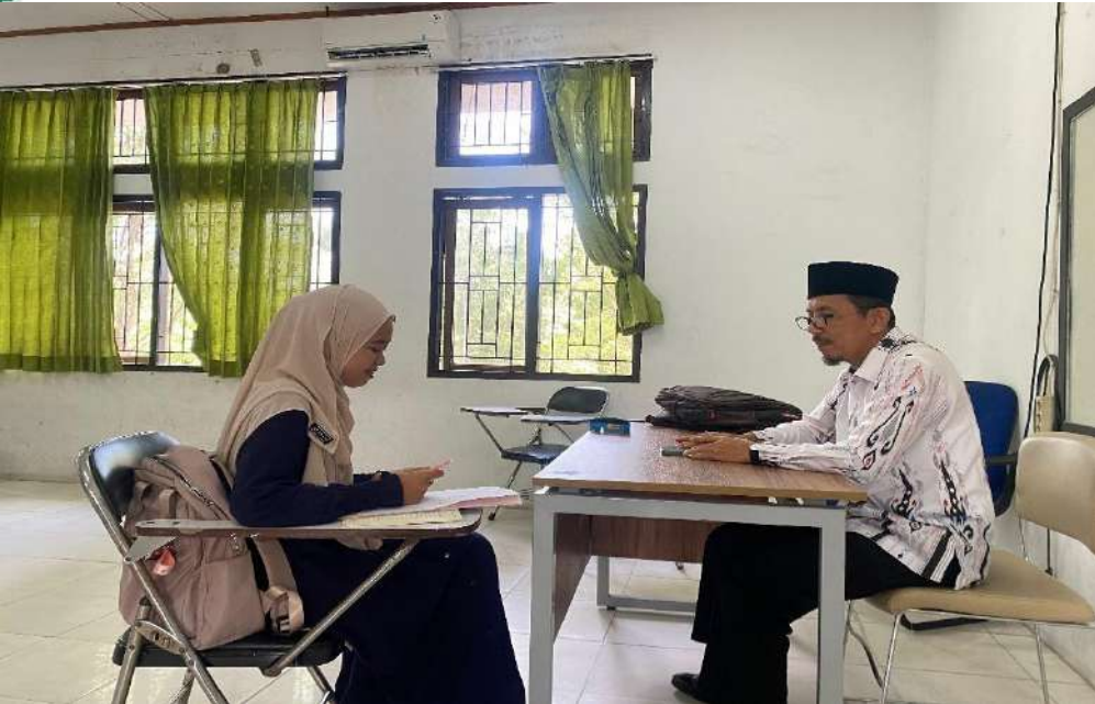
Dokumentasi sesi wawancara