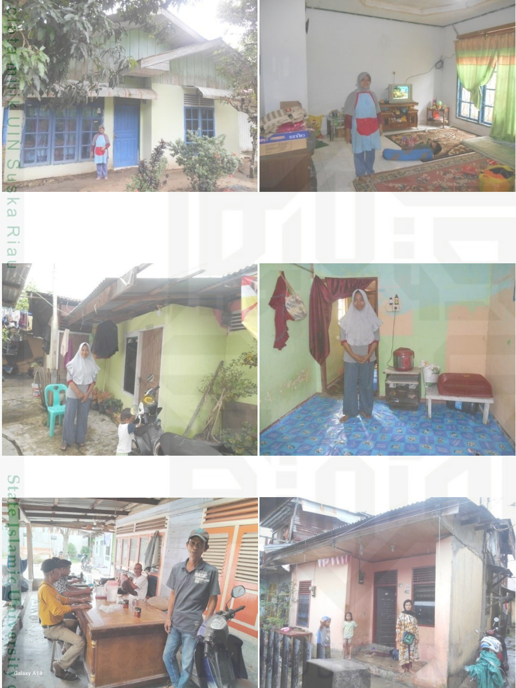
Lampiran 3 : Foto Survey Beasiswa Anak Asuh