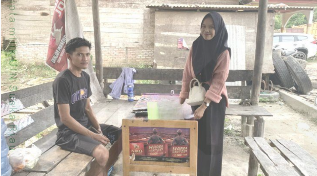
Wawancara dengan pemilik RAM Sawit CV Berkah Mandiri