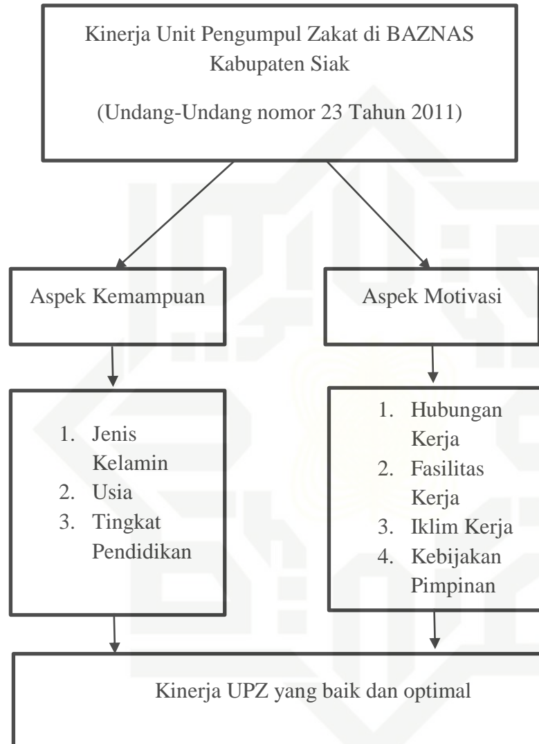
Gambar 2.3 Kerangka Berpikir

Berikut ini adalah gambaran arah penelitian ini :