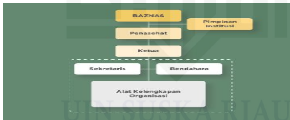
Gambar 2.2 Struktur Organisasi Unit Pengumpul Zakat (UPZ)