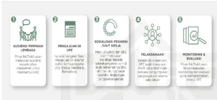
Gambar 2.1 SOP Pembentukan Unit Pengumpulan Zakat (UPZ)