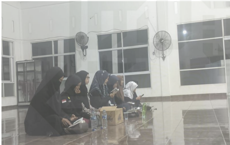
Gambar 1.9 Pembacaan Ratib Al haddad dan Bershalawat