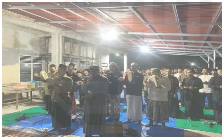
Gambar 1.4 Pembacaan Ratib Al-haddad dan bershalawat