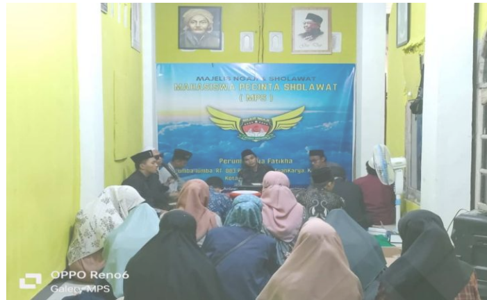
Gambar 1.3 Kajian dari Khodimul Majelis Mahasiswa Pecinta Shalawat