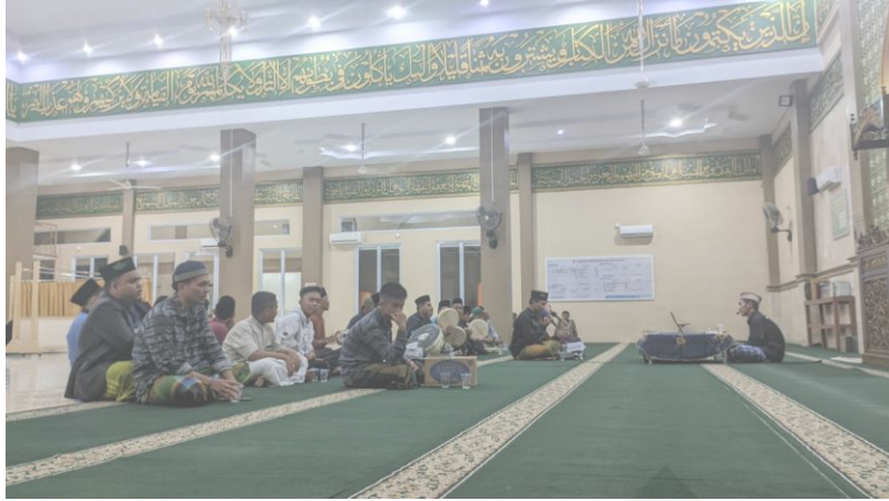
Gambar 1.8 Kajian Malam Sabtu