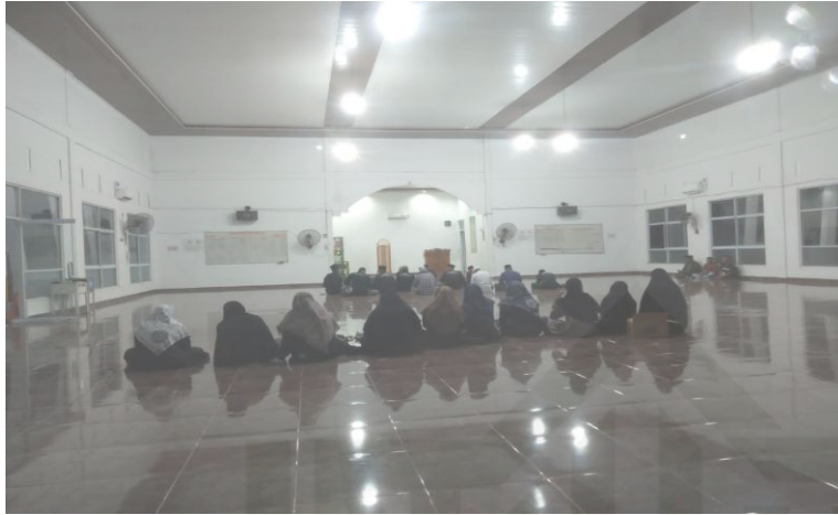
Gambar 1.6 Pembacaan Maulid Simtudurror dan Bershalawat