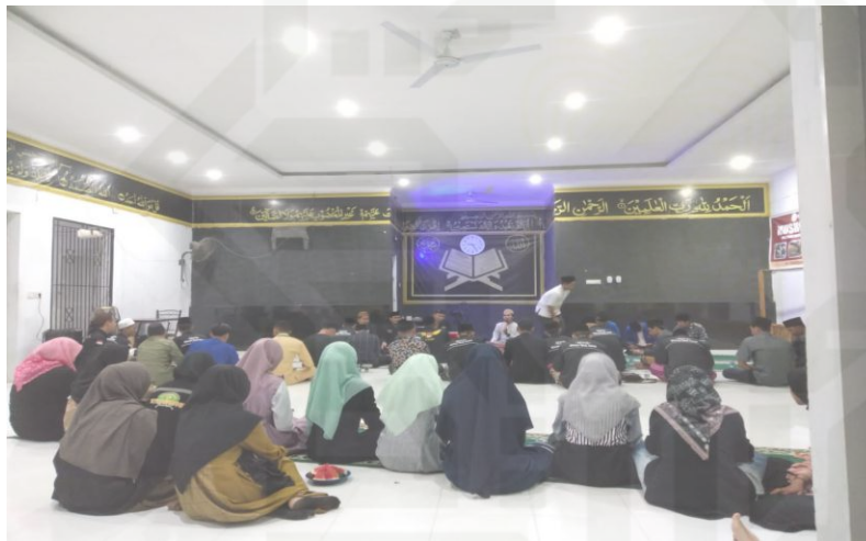
Gambar 1.7 Kajian Malam sabtu dan Bersholawat