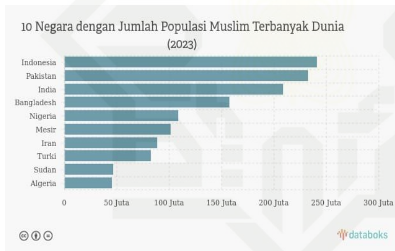
Diagram negara dengan pemeluk agama Islam tertinggi

Dilihat dari gambar 1.1 berdasarkan laporan The Royal Islamic Strategic Studies Centre (RISSC) yang bertajuk The Muslim 500: The World's 500 Most Influential Muslims 2024 , Indonesia merupakan negara dengan populasi muslim terbanyak di dunia. RISSC mencatat jumlah populasi