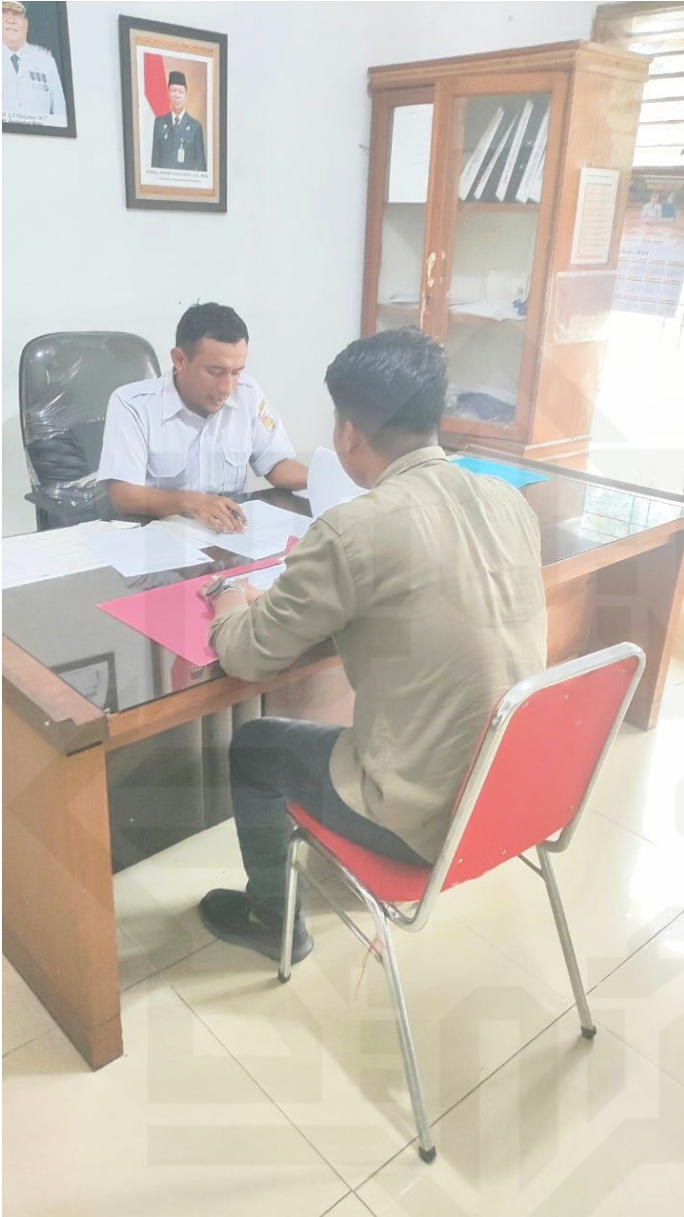
Dokumentasi 2 Wawancara dengan Kepala Kelurahan Simpang Baru