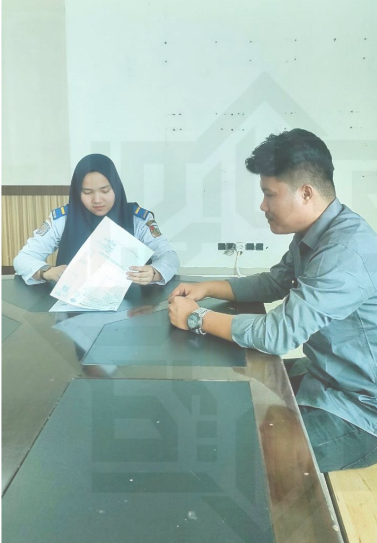
Dokumentasi 1 Wawancara dengan perwakilan Dinas Perhubungan