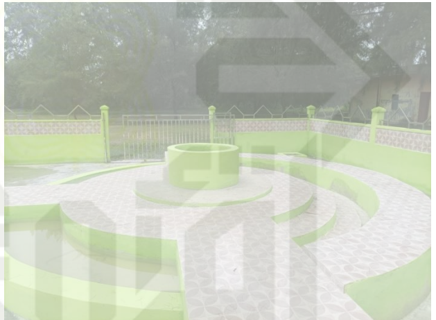
Proses pelaksanaan tradisi mandi safar di desa tanjung punak