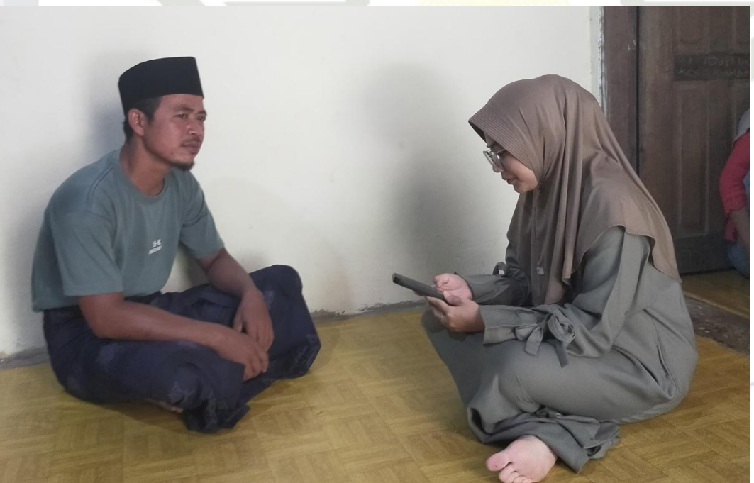
ultan Syarif Kasim Riau