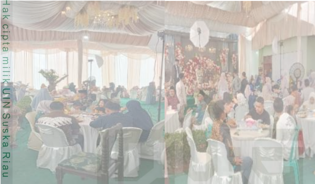
Gambar 2.3 Pelaminan di Luar Rumah