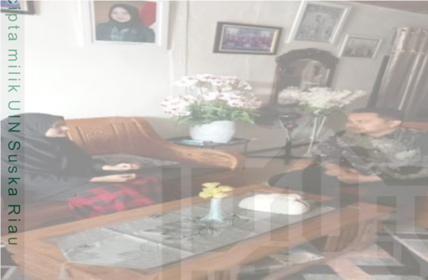
Gambar 1.1 Wawancara dengan Kepala Desa Empat Balai