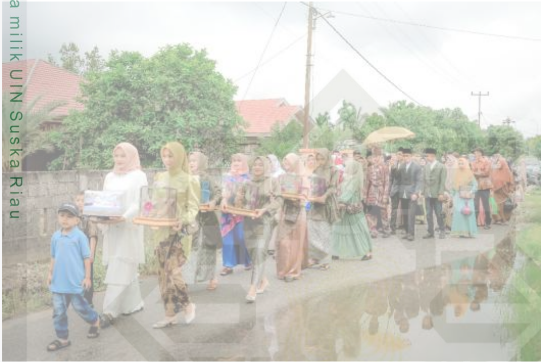
Gambar 2.1 Keadaan Ba Arak