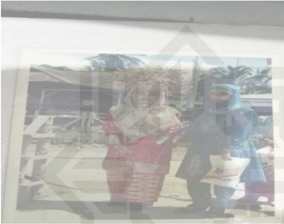
Gambar 1.1 Busana Pengantin Tahun 1995 M