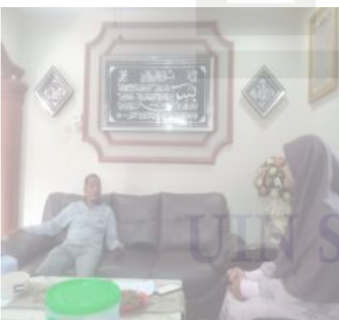
Gambar 1.3 Wawancara bersama Tokoh Agama