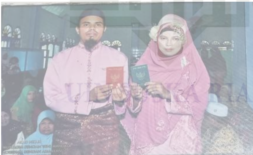
Gambar 1.2 Busana Pengantin Tahun 2013 M