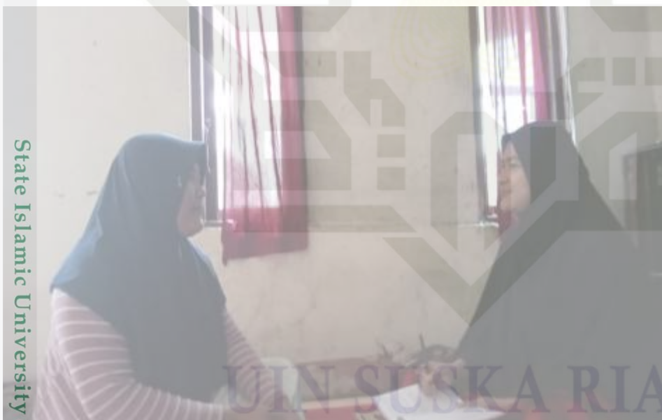
Gambar 1.2 Wawancara dengan Pengantin Desa Empat Balai