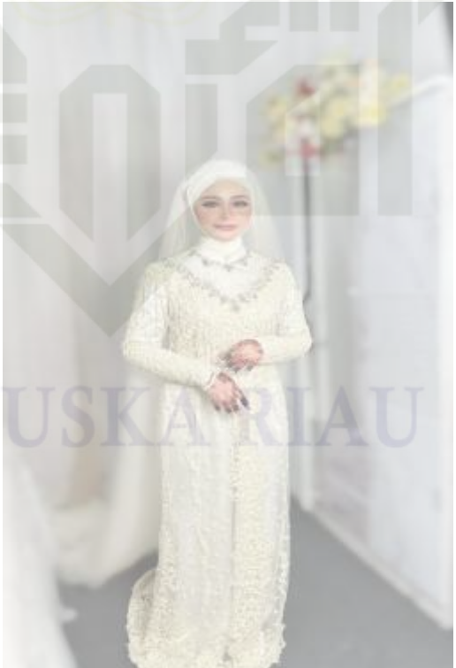
Gambar 1.3 Busana Pengantin 10 Tahun Terakhir

State Islamic University of Sultan Syarif Kasim Riau