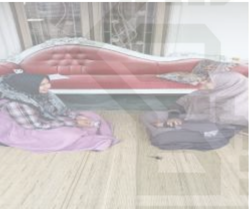
Gambar 1.4 Wawancara bersama Tokoh Adat dan Penata Rias