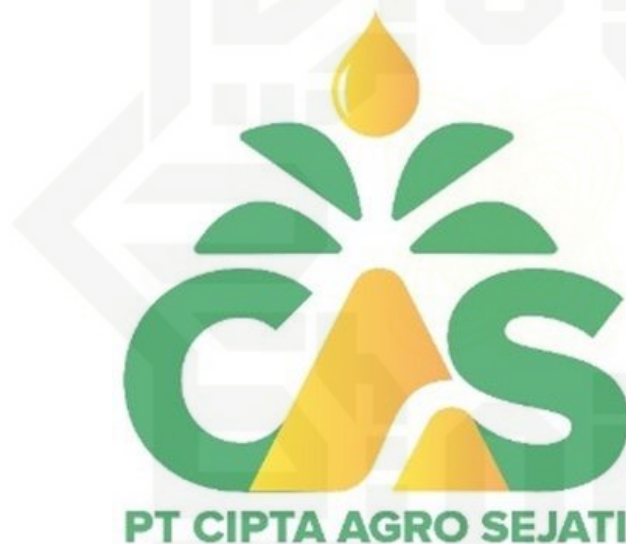
Gambar 4. 1 : Logo PT. Cipta Agro Sejati

Setiap menjalankan proses yang baik maka akan mendapatkan hasil yang baik pula, PT. Cipta Agro Sejati juga memiliki keyakinan, optimisme serta profesionalisme dalam menjalankan bisnis yang selalu mengedepankan mutu dalam setiap produksinya.