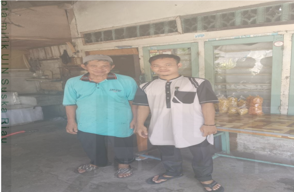
Gambar 1.8 Dokumentasi dengan salah satu penyewa rumah petak