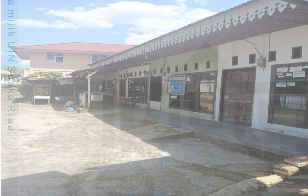
Gambar 1.2 Dokumentasi Rumah petak 4, 5 dan 6