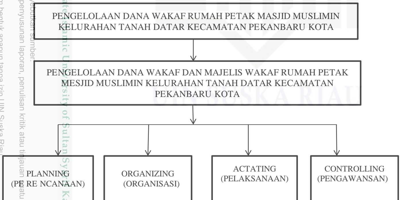
Gambar 2.1 Bagan Kerangka Penelitian

Kerangka berfikir merupakan uraian mengenai kerangka konsep pemecahan permasalahan yang telah dirumuskan. Dalam undang-undang tentang wakaf tahun 2005 pasal 18 ayat (2) yang hubungan benda wakaf tidak bergerak sebagaimana dimaksud ayat (1) dapat diwakafkan beserta bangunan dan/atau tanaman dan/atau benda-benda lain yang berkaitan dengan tanah. Untuk lebih jelasnya lagi, kerangka berfikir dijabarkan dalam bentuk bagan seperti dibawah ini: