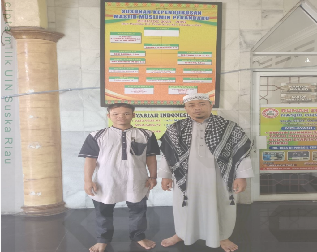
Gambar 1.6 Dokumentasi wawancara dengan petugas wakaf