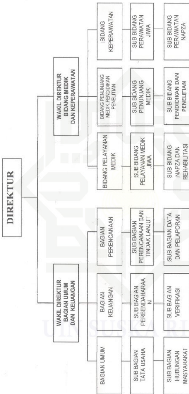
Sumber data : Rumah Sakit Jiwa Tampan Provinsi Riau