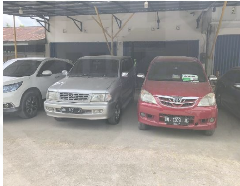
Mobil yang Ada di Showroom Sonic Mobilindo Pekanbaru

Makelar Pada Showroom Sonic Mobilindo Pekanbaru