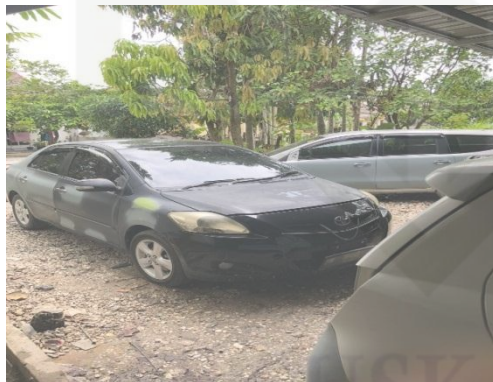
Bengkel Showroom Sonic Mobilindo Pekanbaru