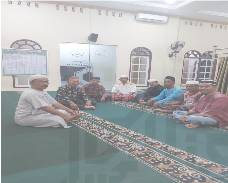
Foto Depan Masjid Al-Muhajirin