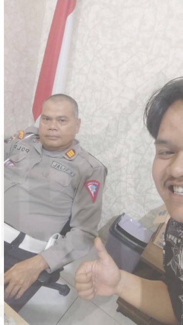
Gambar: Bapak AKP Ahmad Rizal,S.H Wakil Kepala Satuan Lalu Lintas Polresta Bukittinggi