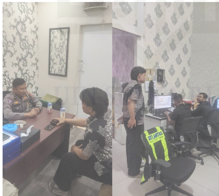
Gambar: Anggota Polisi lalu lintas Polresta Bukittinggi