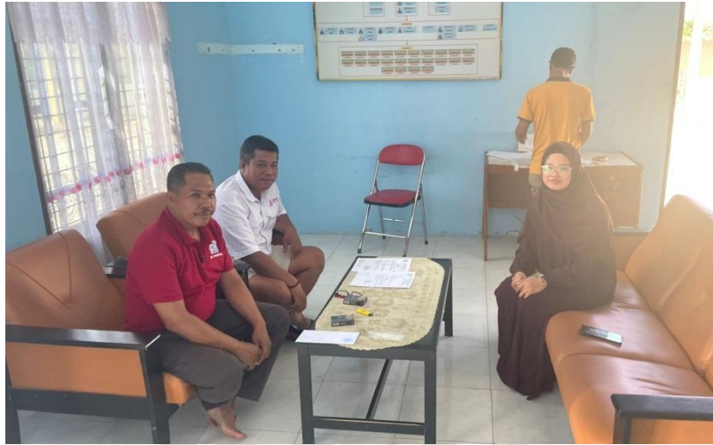
Gambar 3. Bersama Ketua KPPS Mekar Jaya Desa Sei Lembu dan Perwakilan dari PT. Rama Jaya Pramukti