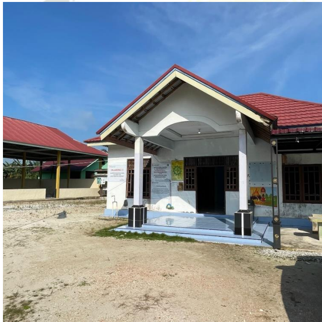
Gambar 1 dan 2 Kantor KPPS Mekar Jaya Desa Sei Lembu