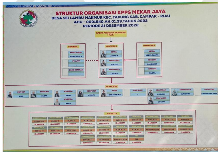
Gambar 4. Struktur Organisasi KPPS Mekar Jaya Desa Sei Lembu