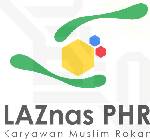
Gambar 4.2 Logo Laznas PHR