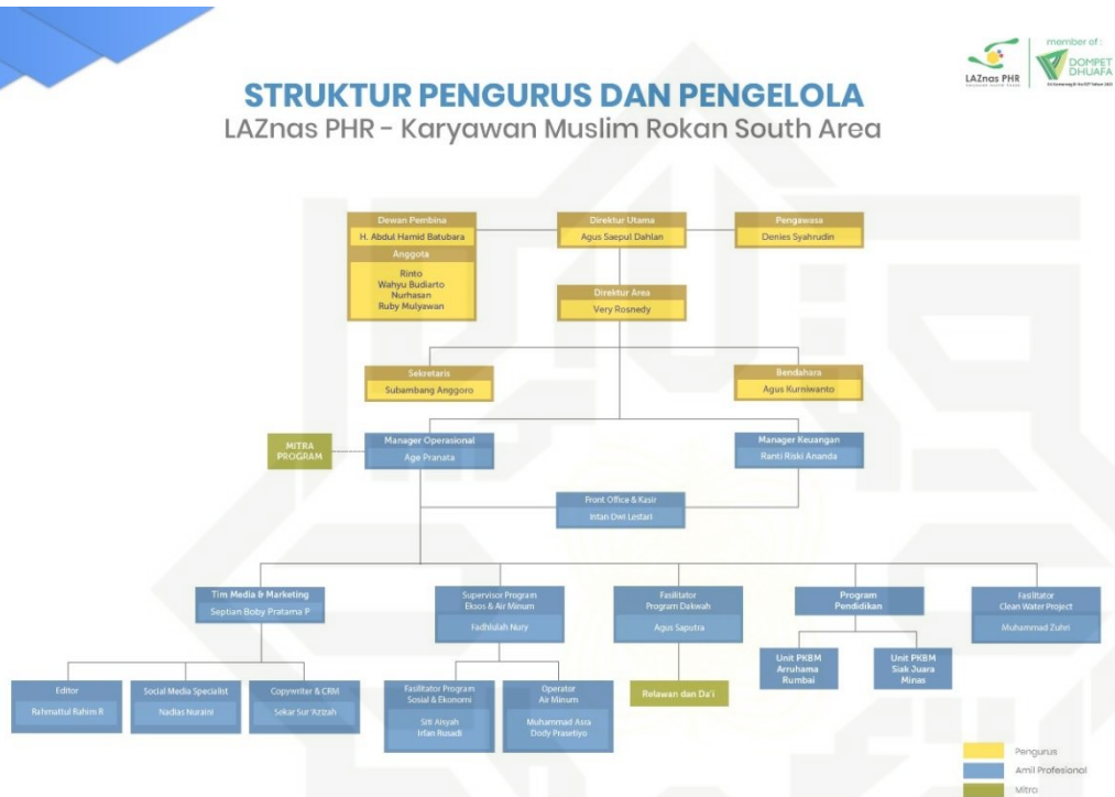
Gambar 4.1 Struktur Laznas PHR