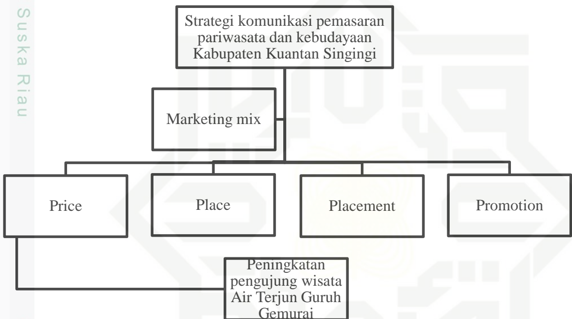
Gambar 2.3. Kerangka Berpikir Penelitian

Kerangka pemikiran mengembangkan teori yang telah di susun, dan menguraikan, serta menjelaskan hubungan-hubungan yang terjadi antara variable yang diperlukan untuk menjawab masalah penulisan. Kerangka pemikiran merupakan model konseptual tentang bagaimana teori berhubungan dengan berbagai faktor yang telah di definisikan sebagai masalah yang penting. (Feroza & Misnawati, 2020)