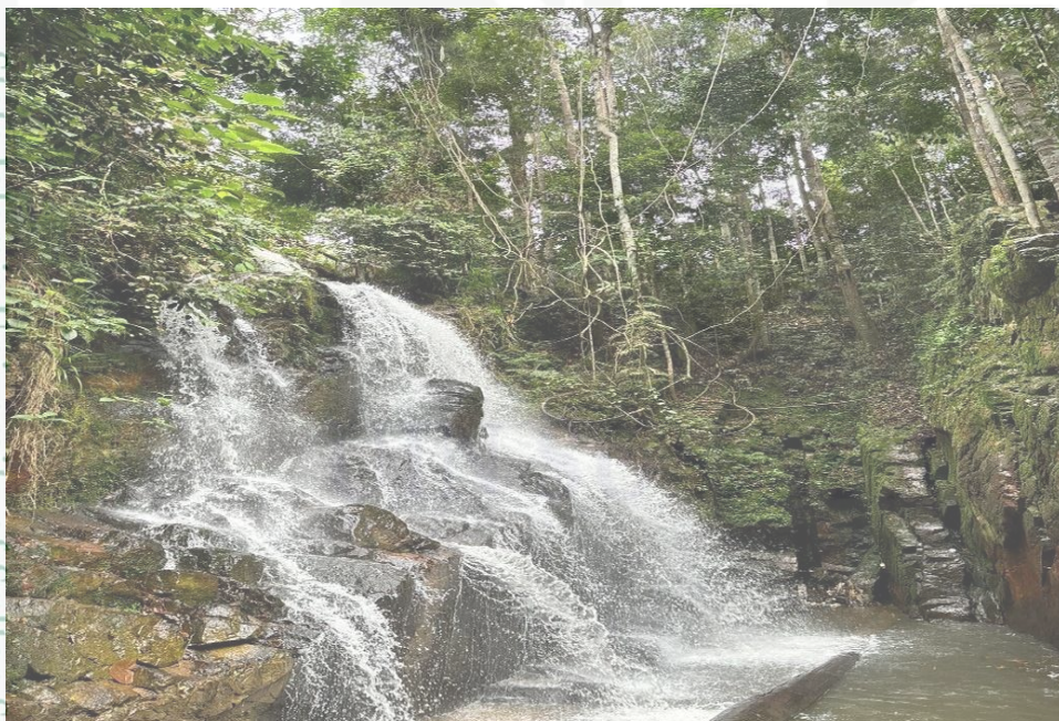
(gambar Air Terjun Guruh Gemurai )

(Gambar masuk ke destinasi objek wisata air terjun Guruh Gemurai)