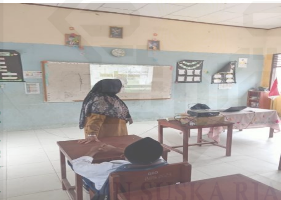
State Islamic University of Sultan Syarif Kasim Riau