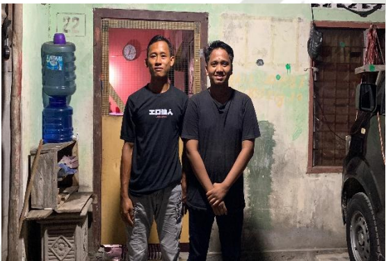
Gambar : Nasabah Asuransi Pendidikan Bumi Putera Cabang Sungai Pakning