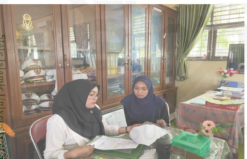
State Islamic University Sultan Syarif Kasim Riau