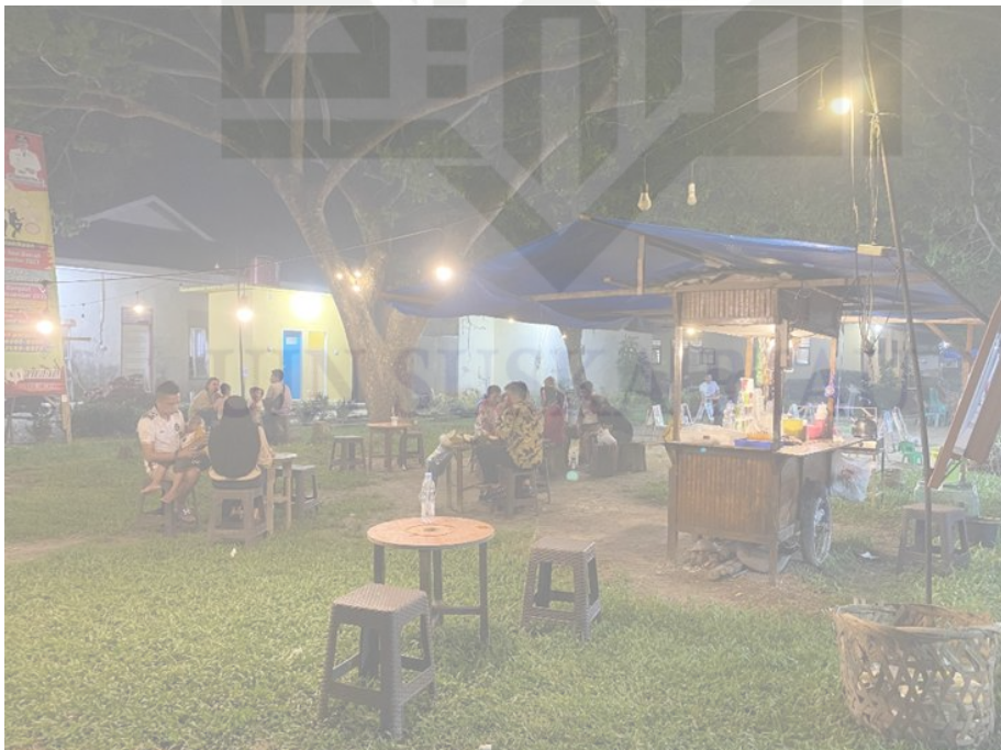
Keterangan: dokumentasi asli suasana angkringan pada malam hari di desa petapahan