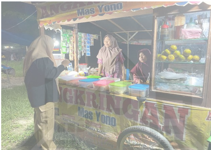
Keterangan: dokumentasi asli pengusaha angkringan di desa petapahan