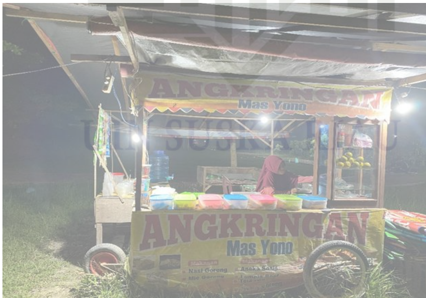
Keterangan: dokumentasi asli gerobak angkringan pengusaha angkringan