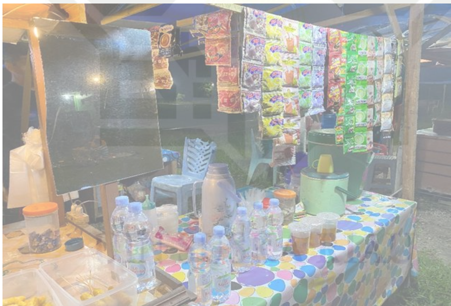
Keterangan:dokumentasi asli salah satu menu angkringan di desa petapahan