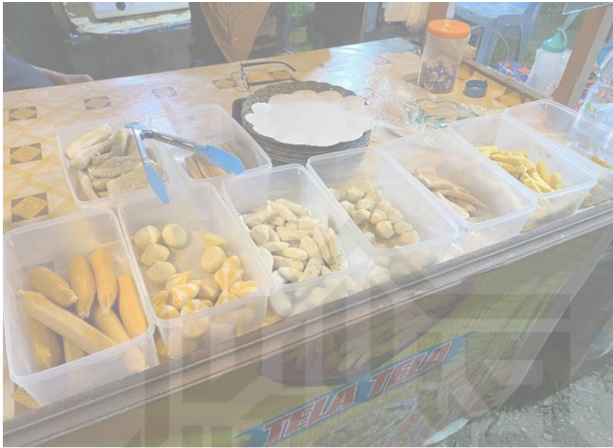
Keterangan:dokumentasi asli salah satu menu angkringan di desa petapahan