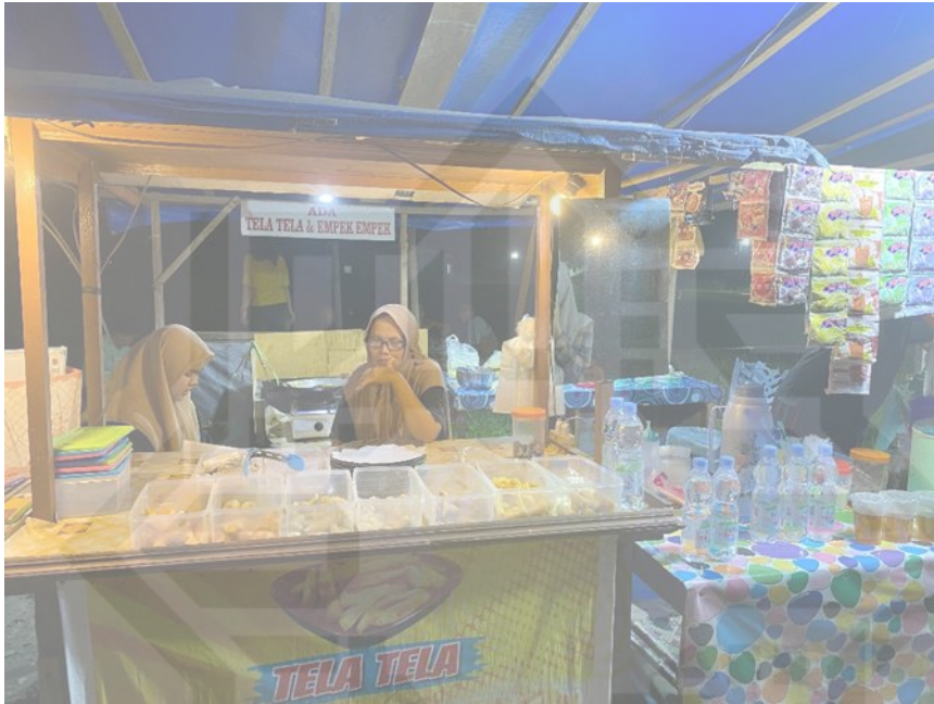
Keterangan: dokumenasi asli pedagang angkringan di desa petapahan