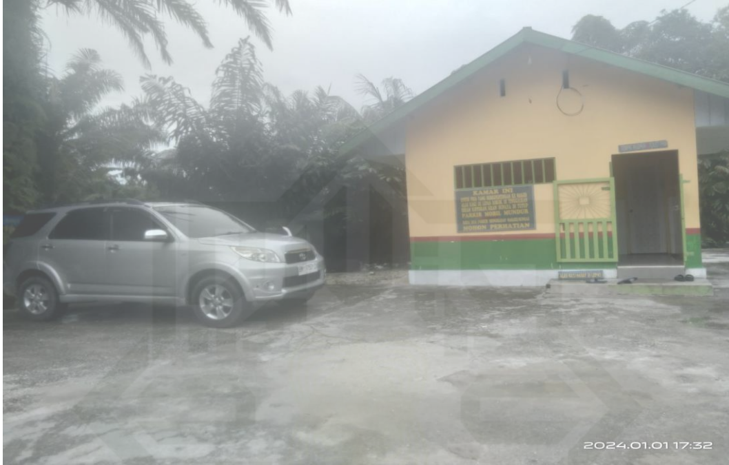
Gambar lahan parkir wisata halal