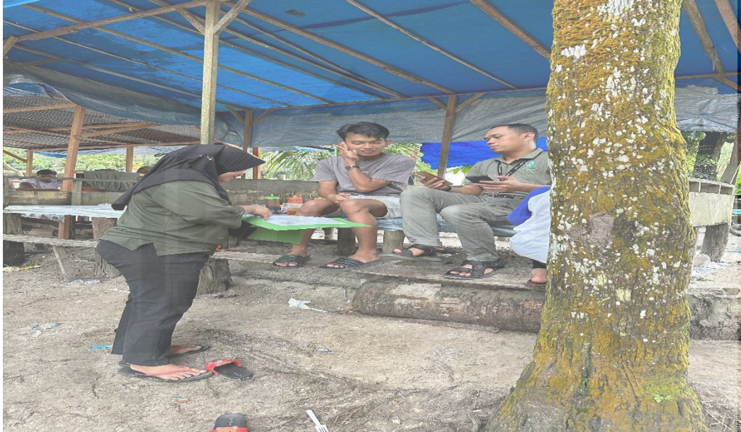
Gambar meakukan wawancara pengelolah wisata halal