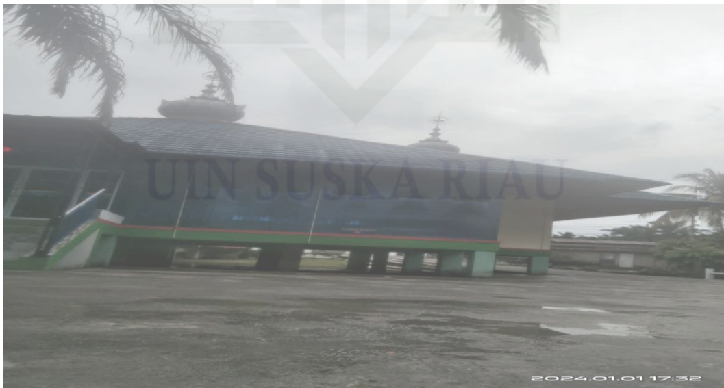
Gambar Musholah Wisata halal