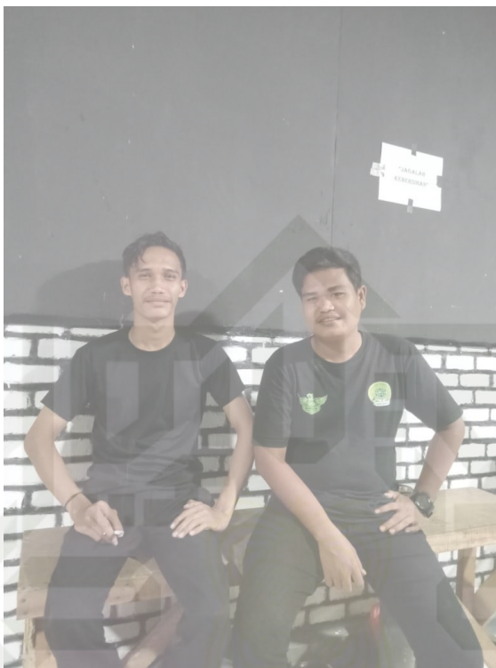
Zuhri Selaku Karyawan Catering Angle