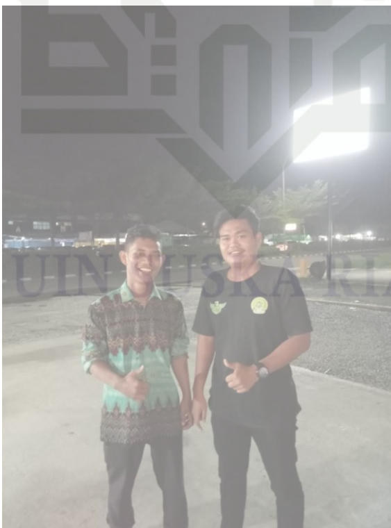
Risky Aditya Selaku Karyawan Catering Angle